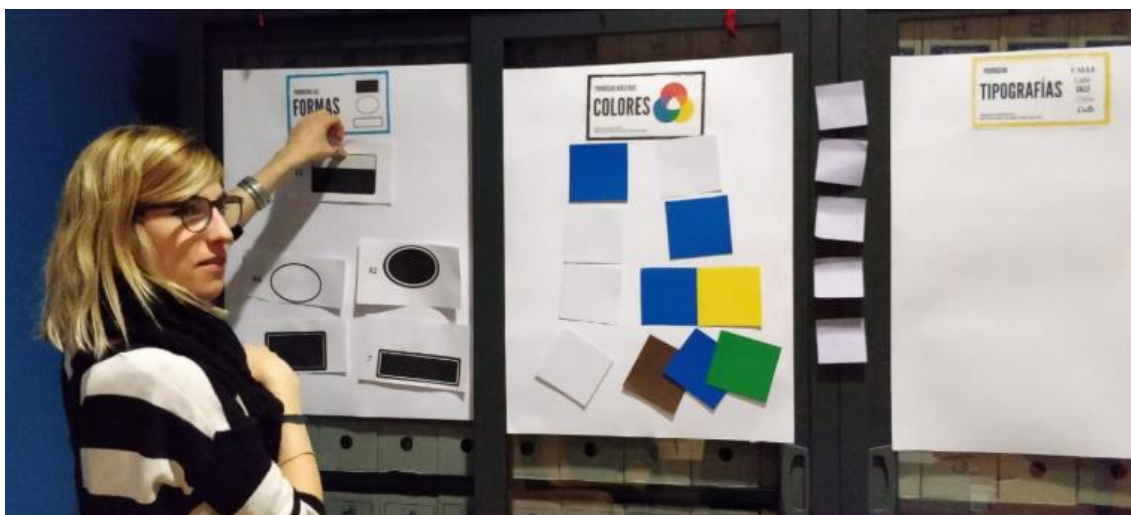
Ilustración 5. Puesta en común y conclusiones