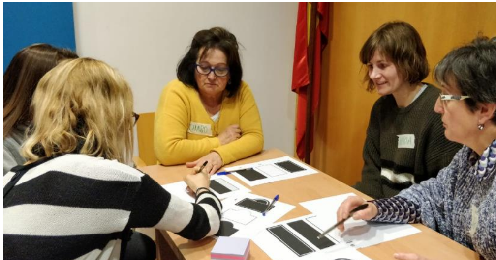
Ilustración 3. Trabajo por grupos