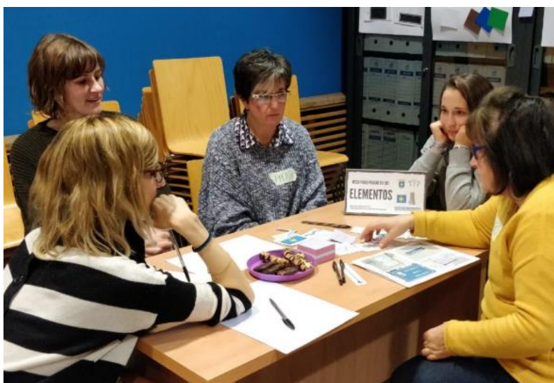
Ilustración 4. Mesa trabajo "elementos"