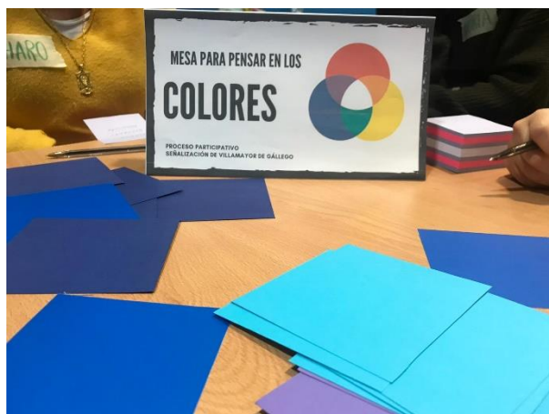
Ilustración 2. Mesa de colores

Se anima la conversación haciendo preguntas sobre los colores que representan a Villamayor de Gállego, recogemos la siguiente información: