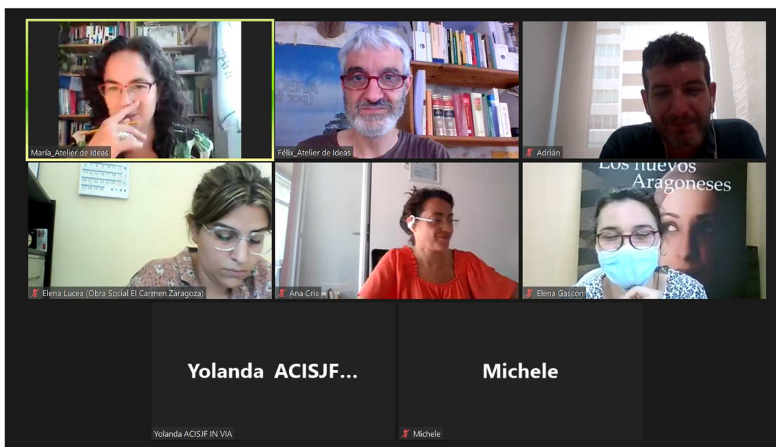
Imagen 1- Momento de trabajo en plenario

La sesión participativa se desarrolló durante la mañana del 21 de junio de 2022, en formato online, y tuvo una duración de 2 horas y media, de 10 a 12:30 horas.