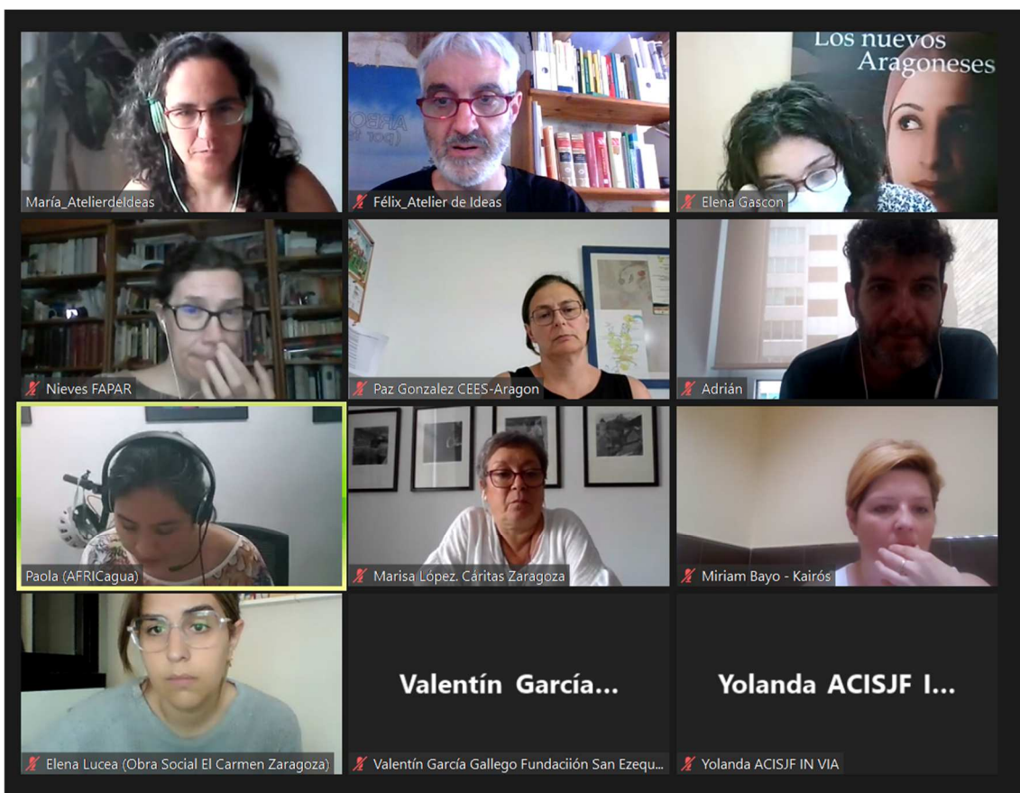
Imagen 4- Imagen de cierre del taller

Desde el equipo de facilitación se recordó por último la próxima cita prevista para el jueves 16 de junio en el mismo horario.