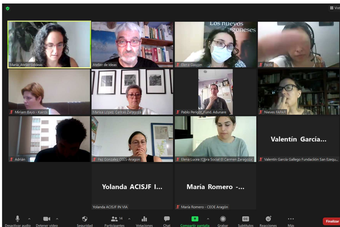
Imagen 2- Momento de explicación en plenario del contenido a trabajar durante la sesión

Línea estratégica Convivencia Intercultural: objetivos 4 a 7 con sus medidas correspondientes